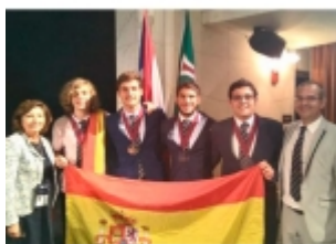
Delegación española participante en la Olimpiada Iberoamericana de Física